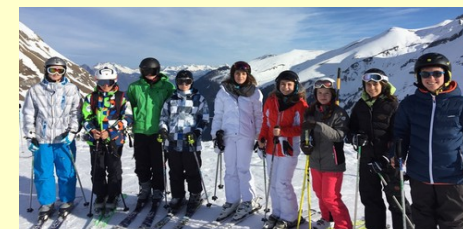
Un samedi à la neige