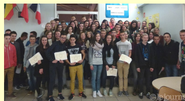
Les lauréats du DNB