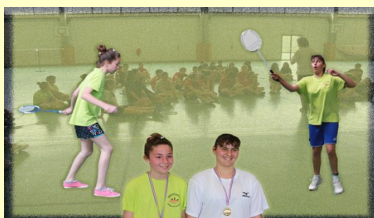
Nos championnes de badminton! (année 2017-2018)