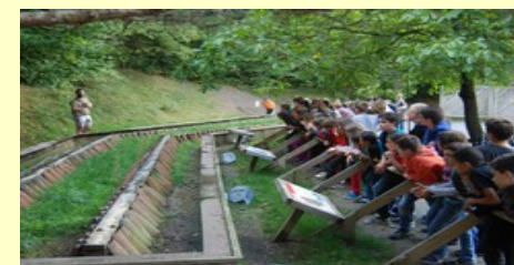
Voyage d'intégration des 6 èmes à Courzieu