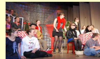
Les acteurs en représentation